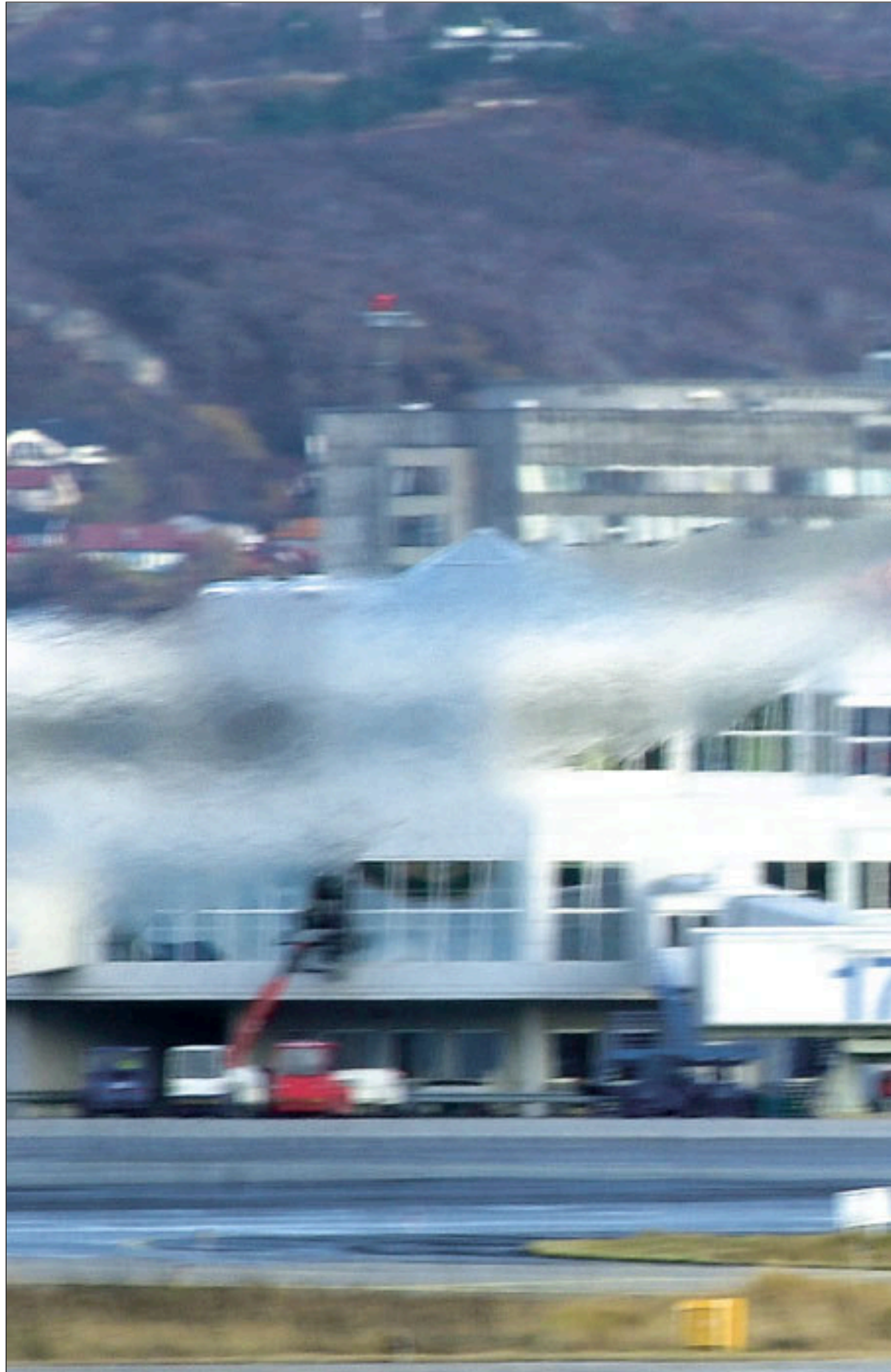
Flere. Bodø kan få hele jagerflyflåten. Det betyr en betydelige økt kapasitet og langt flere fly.

– De ansatte har enkelt og greit fått beskjed om å holde kjeft. Hvis det lekkes til media kan personer