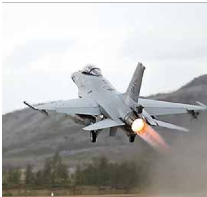
ØNSKER FLY – MEN IKKE STØY: Bodø vil gjerne ha de norske kampflyene, men ønsker at flyene skal til Sverige for å øve.

Rådmannen i Bodø minner om at det er ledig luftrom rundt Bo-