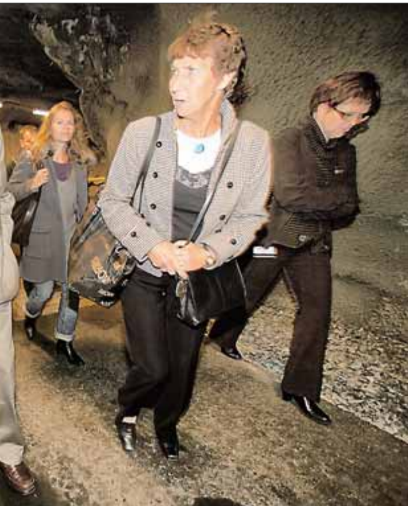
er lagt fram for Evenes. Han tror heller ikke den alminnelige bodøværing vet