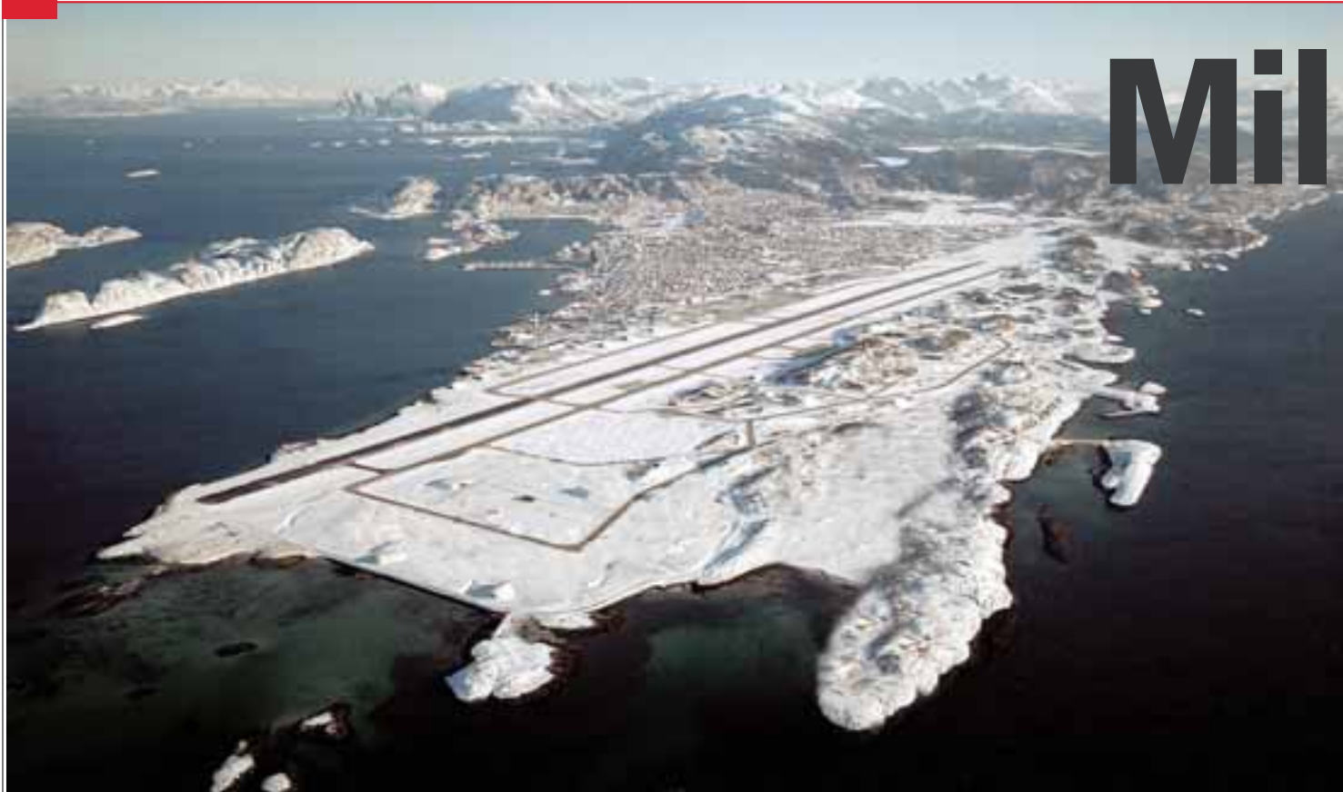
KOSTER DYRT: Det kan bli dyrt å samle de nye kampflyene i Bodø. Nye sjokktall, som legges fram denne uken, kan vise behov for milliardinvesteringer for å etterisolere inntil 3.000 bolighus i Bodø.