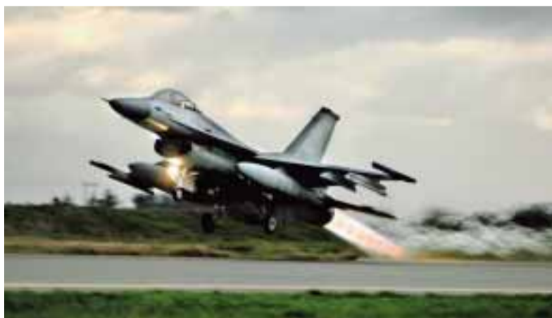
ØRLAND: F16-fly på Ørland. Senterpartiet har bestemt seg for å dele jagerflyene mellom Bodø og Ørland.