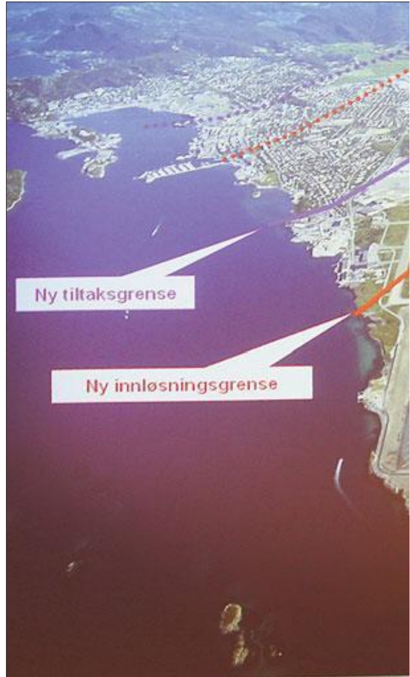
Vil ha ny rullebane. Ordfører Odd-Tore Fygle gjorde en knallsøknad i kampen om