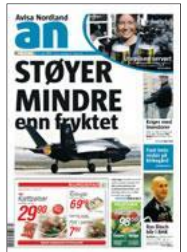
Faksimile. AN 17. april side 1