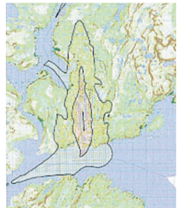
STØYKART: Her er det foreløpige støykartet for Evenes.